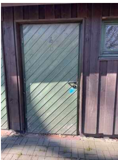
Öffentliches WC am Wurstkultur Imbiss