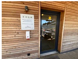
Öffentliches WC Strandallee