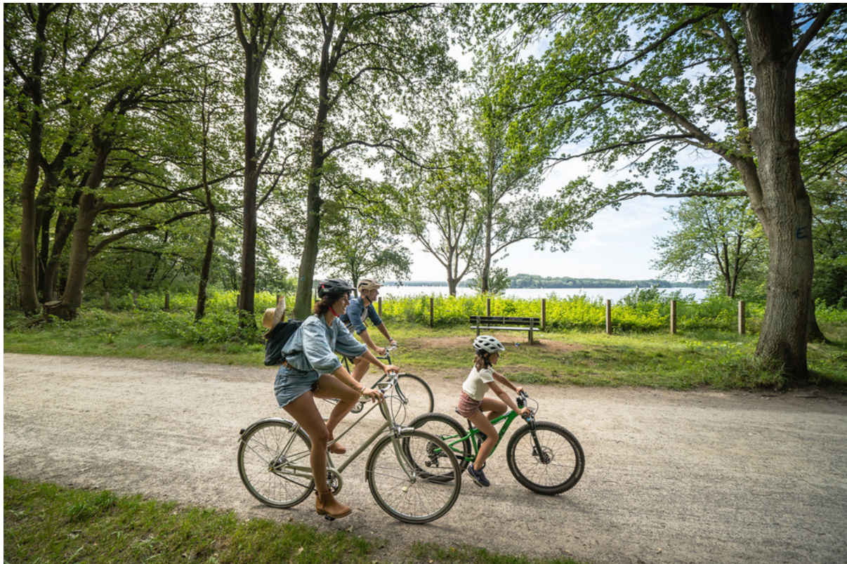
Einmal um den See | © Naturpark Hohe Mark / Dennis Stratmann