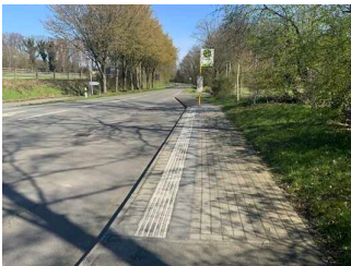
ÖPNV Haltestelle Stadtmühle